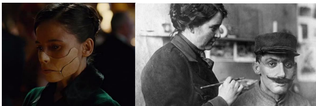
Fig. 4. A izquierda la Dr. Maru en el film (captura del mismo), a la derecha las máscaras usadas en la guerra.

Otro elemento curioso que se puede encontrar son las máscaras o prótesis faciales, como la que lleva la doctora Maru. Estas máscaras ocultaban los rasgos desfigurados por heridas de guerra, creadas por escultores, como Francis Derwent Wood o Anna Coleman Ladd. Se trataban de unas mascararas bastante incómodas pero que ayudaban a los heridos a volver a adaptarse a la sociedad. Estaban fabricadas en cobre, tras realizar un molde a medida, y se le añadían detalles como pelo para hacer las cejas, bigote, etc. Su función era meramente estética, pues no ayudaban a recuperar funciones perdidas.