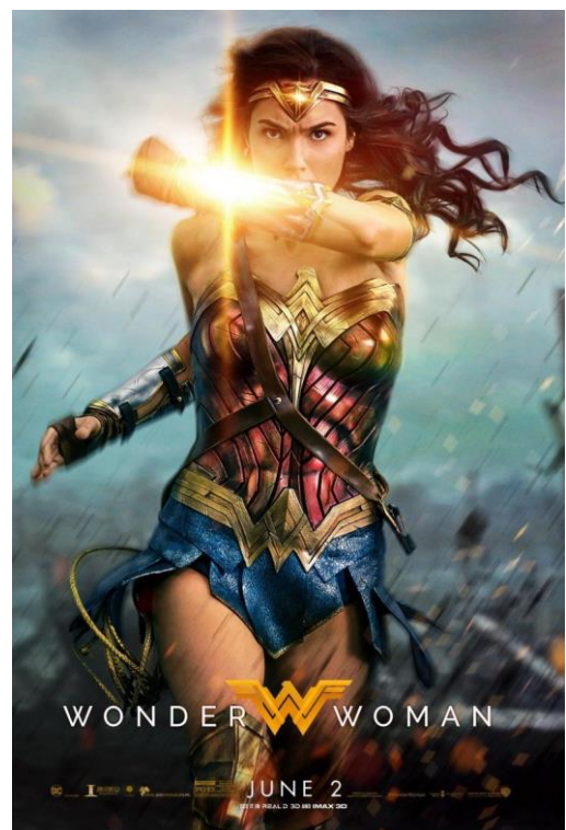
Fig. 1. Cartel de la película.

Reperto: Gal Gadot, Chris Pine, Elena Anaya, David Thewlis, etc.