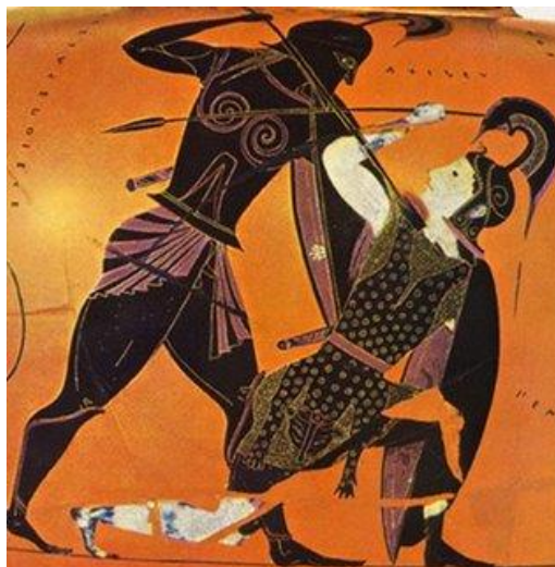
Fig. 2. Penthesilea y Aquiles en la guerra de Troya.

existieron otras reinas amazonas como Antíope y Penthesilea, las cuales también aparecen representadas en la película).