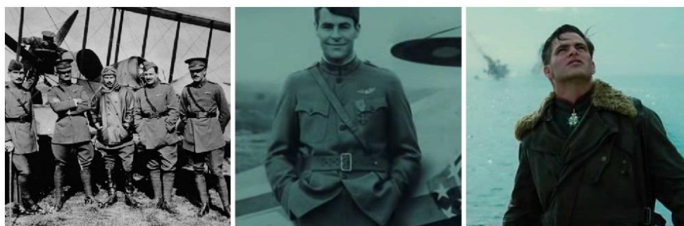
Fig. 8. Diferentes trajes de aviación. A la derecha el uniforme alemán y en el centro el británico, ambos usados en la película.

El traje con el que vemos a Steve al principio de la película podría dar la sensación de ser posterior, pero se trata de un traje de aviación de la Primera Guerra Mundial. En este momento Steve se encuentra infiltrado en el ejército alemán por lo que lleva un uniforme acorde con ello, e incluso porta una medalla que es una máxima condecoración, conocida como Blue Max o Pour le mérite . Al final de la película se muestra una fotografía donde aparece con el traje de aviación del ejército británico, el que en realidad le corresponde, y que se ajusta fielmente a la realidad.