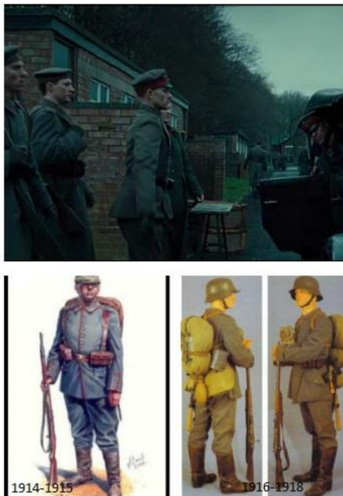
Fig. 6. Uniformes alemanes en el film y en la realidad.

Sin embargo, no es el caso de la vestimenta masculina, pues los uniformes de los soldados en algunos casos son erróneos, y pertenecen a la Segunda Guerra Mundial y no a la Primera. Los uniformes alemanes que vemos en la películas son más parecidos en el corte y estilo a los utilizados en el segundo conflicto, con un color diferente. Aunque bien es cierto que hacia el final de la guerra cambian el tipo de uniforme, pero aún así sigue sin ser el correcto.