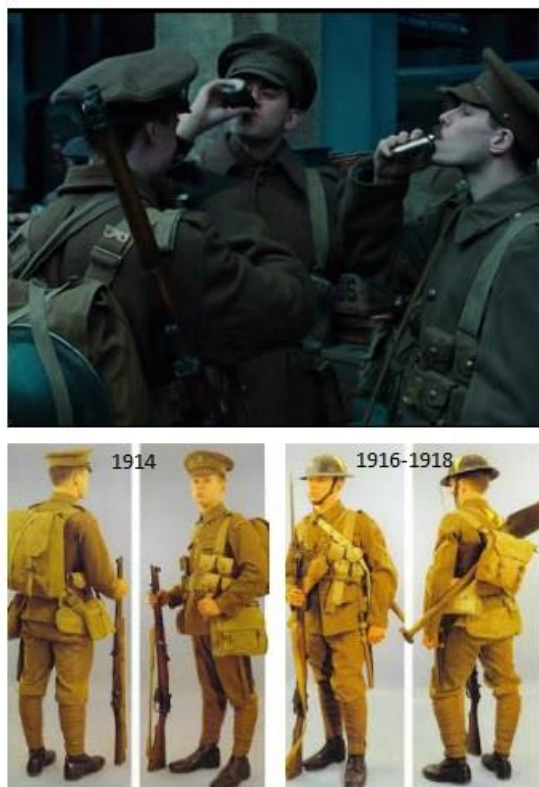
Fig. 7. Uniformes británicos en la película y en la realidad.

El traje con el que vemos a Steve al principio de la película podría dar la sensación de ser posterior, pero se trata de un traje de aviación de la Primera Guerra Mundial. En este momento Steve se encuentra infiltrado en el ejército alemán por lo que lleva un uniforme acorde con ello, e incluso porta una medalla que es una máxima condecoración, conocida como Blue Max o Pour le mérite . Al final de la película se muestra una fotografía donde aparece con el traje de aviación del ejército británico, el que en realidad le corresponde, y que se ajusta fielmente a la realidad.